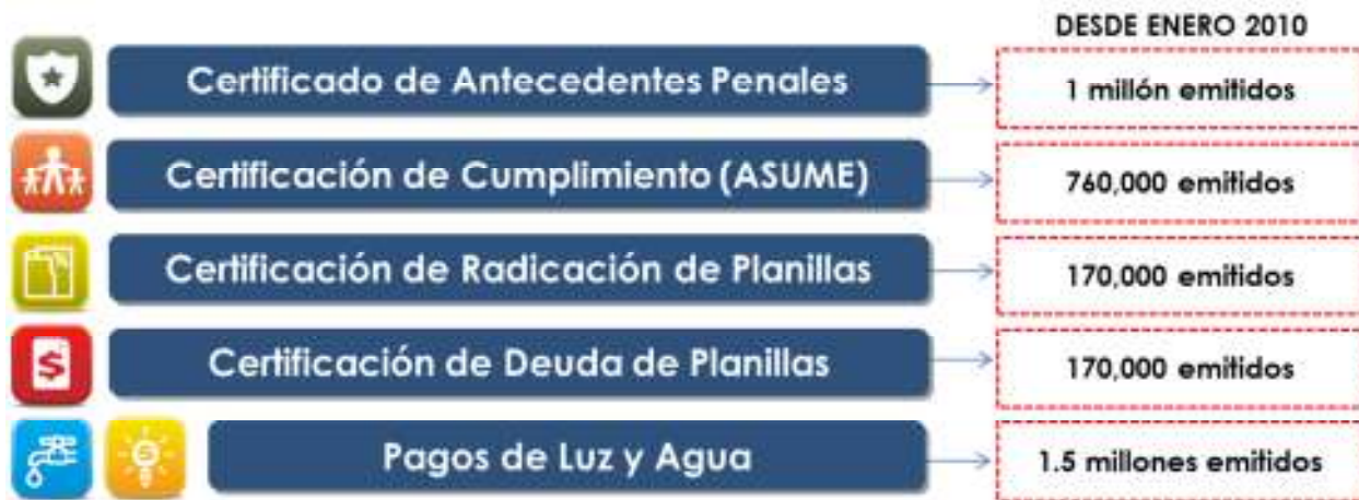
TABLA 27 SERVICIOS EN LÍNEA MÁS SOLICITADOS EN PR.GOV