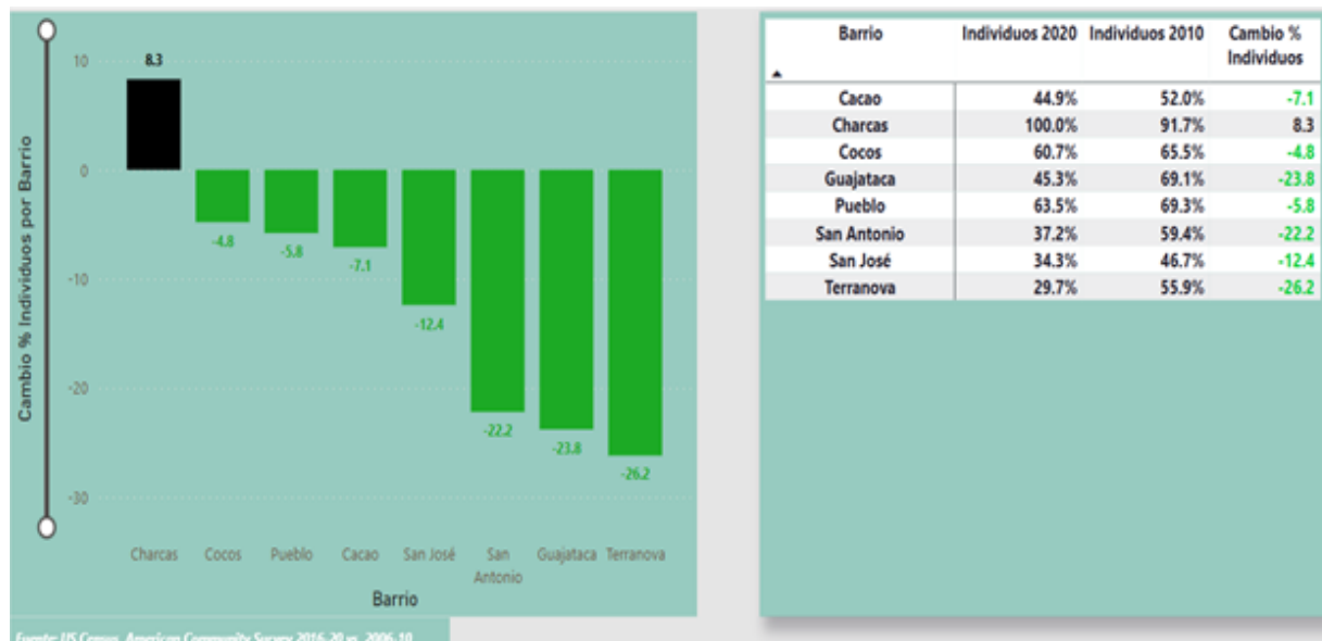
Figura 3: Individuos bajo los niveles de pobreza por barrio 2020 vs. 2010: municipio de Quebradillas

La figura 3 presenta un resumen comparativo de los individuos bajo el nivel de pobreza en los barrios que componen el municipio de Quebradillas. Al comparar los resultados de la ECPR 2020 vs. ECPR 2010, el nivel de pobreza se redujo en seis (6) de sus ocho (8) barrios. Se destaca la contracción de 26.2 puntos porcentuales en el nivel de pobreza de los hogares compuestos por individuos en el barrio Terranova que fue desde 55.9% en el año 2010 hasta 29.7% en el año 2020. El único barrio que presenta crecimiento en su nivel de pobreza de hogares compuestos por individuos fue Charcas (8.3 puntos porcentuales).