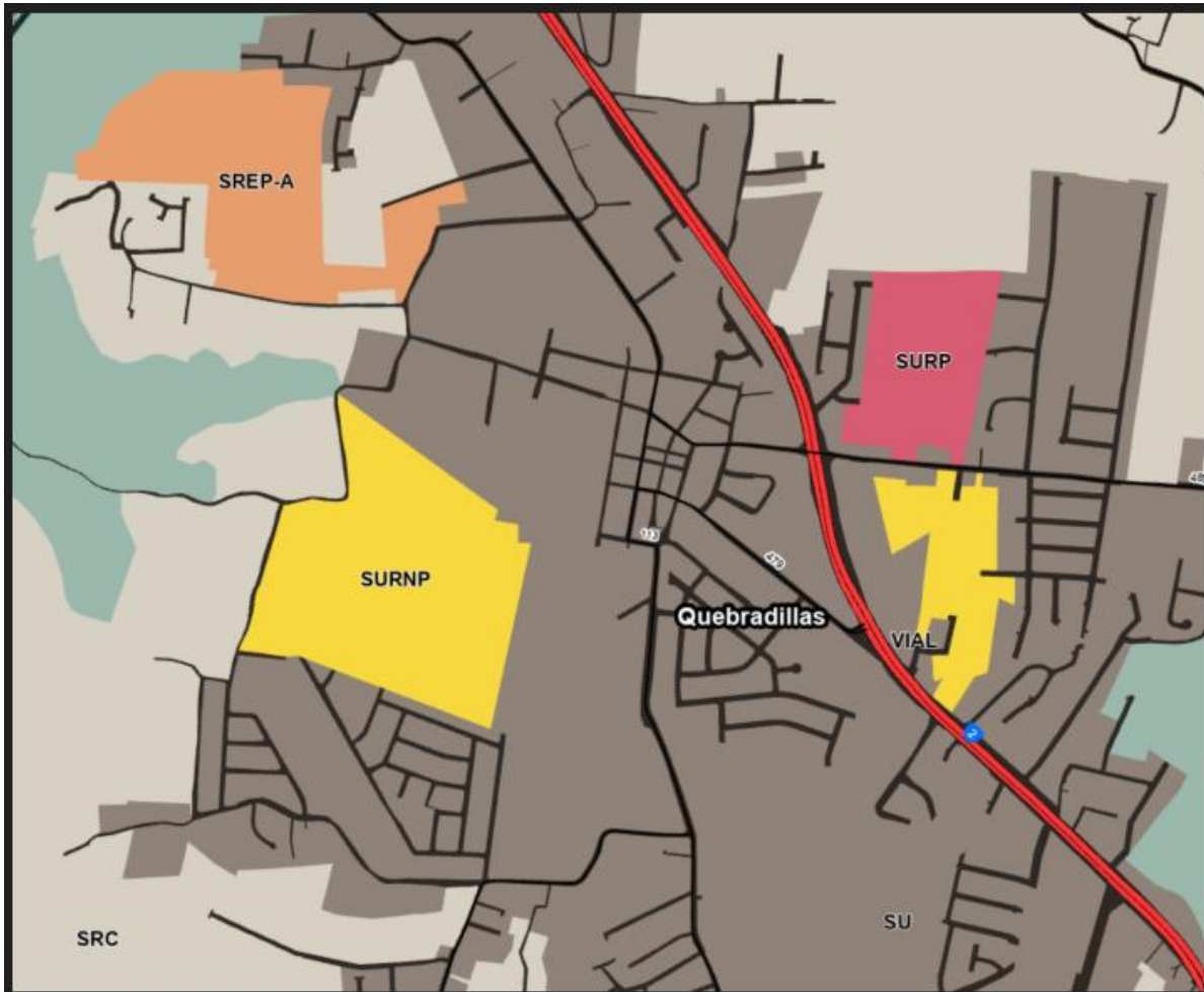
Figura 5: Clasificación vigente PUT-PR 2015 : Suelos Urbanizables

Las figuras 5 y 6 a continuación ilustran los cambios de las clasificaciones de Suelos Urbanizables a Suelos Urbanos, respectivamente que surgieron a raíz de la revisión de las calificaciones de las parcelas correspondientes como parte de la RIPOT 2025. En la figura 5 se aprecian las 104.4 cuerdas de SUNP en amarillo y las 28.4 cuerdas de SURP en rojo, según el PUT-PR 2015. Por otro lado, en la figura 6 se incluye la clasificación propuesta de SU para estas parcelas en la RIPOT 2025. El anejo B incluye todos los cambios de clasificación al PUT-PR 2015 por número de catastro.