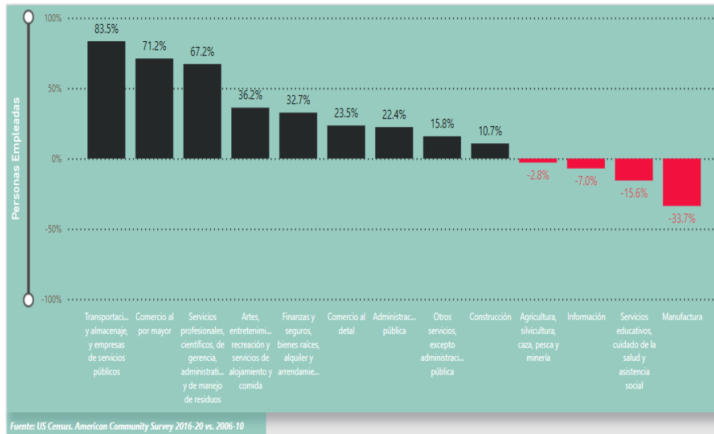
Figura 4: Cambio porcentual en el empleo por sector industrial: municipio de Quebradillas 2020 vs. 2010