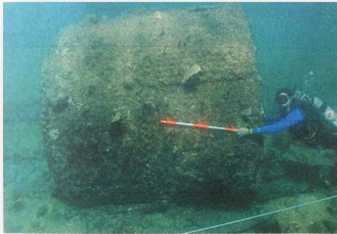
Foto 43, Hornos de Caldera a Babor