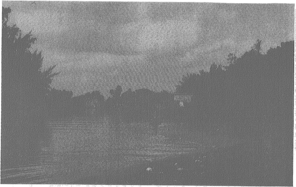
Otras estampas del Río de Bayamón. Al lado derecho el área de Palo Seco.