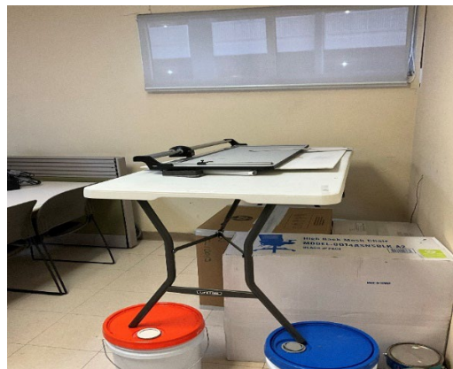
Área improvisada para el corte de los marbetes, a la que se accede desde la oficina donde está ubicada la impresora de impresión de marbetes.