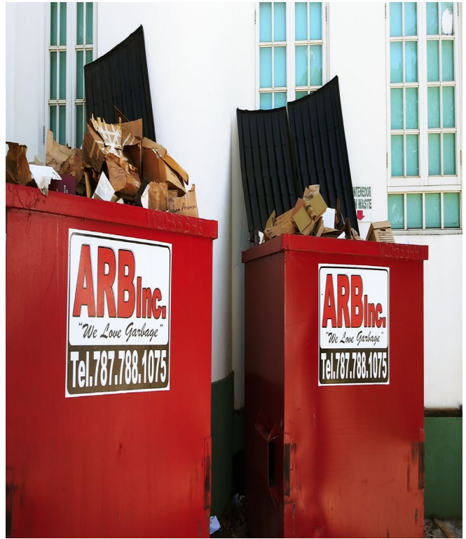
Fotos de los Libros Decomisados Febrero 18, 2021