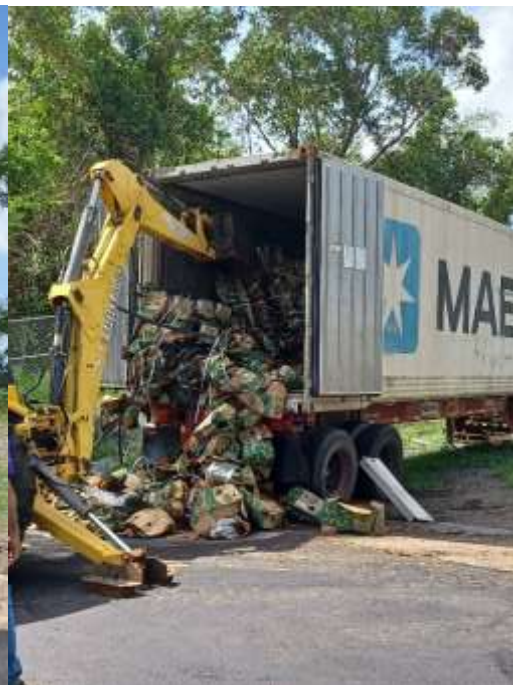
Trabajos realizados el 10 de mayo en Cayey – Contenedor MNBU3258076