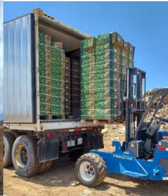
Trabajos del 9 de mayo – Segundo contenedor