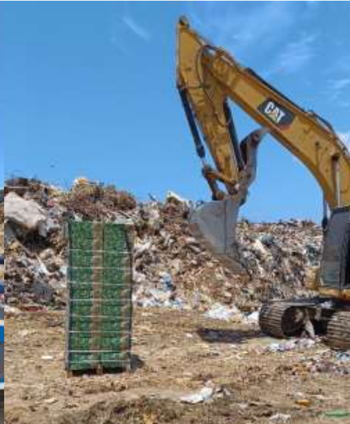
Trabajos realizados el 9 de mayo en Vega Baja – Primer contenedor