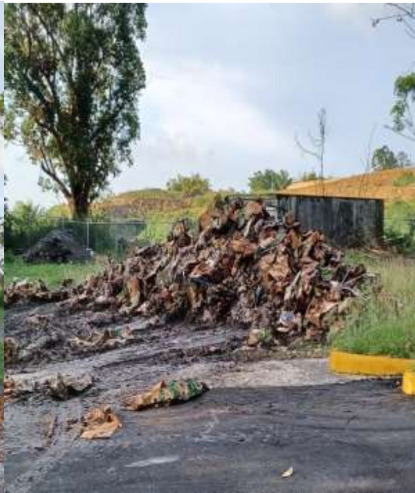
Trabajos culminados el 10 de mayo en Cayey