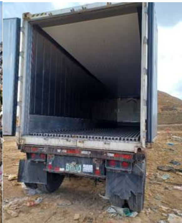
Contenedor MNBU3766159 terminado