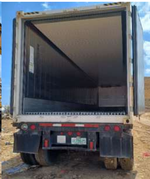
Contenedor MMAU137136 terminado