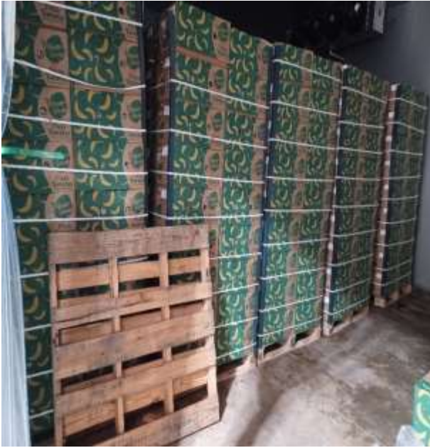
Guineos en neveras de ADEA Cayey