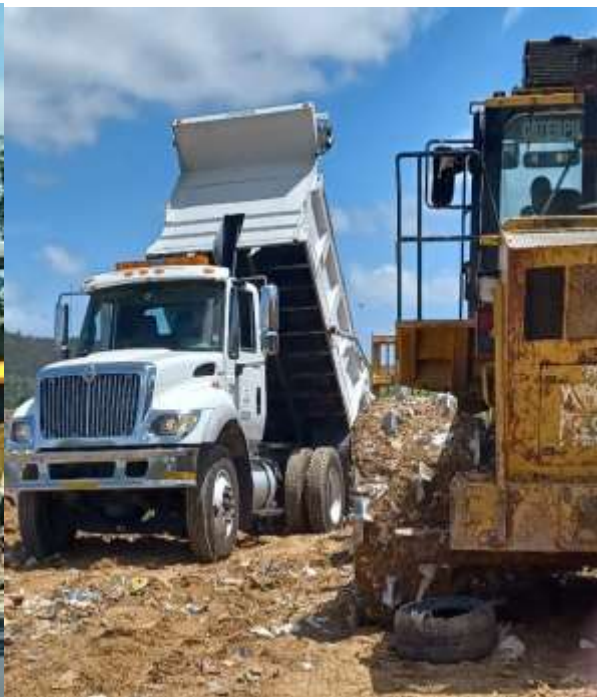
Trabajos del 11 de mayo en Cayey - Contenedor MNBU3258076 terminado