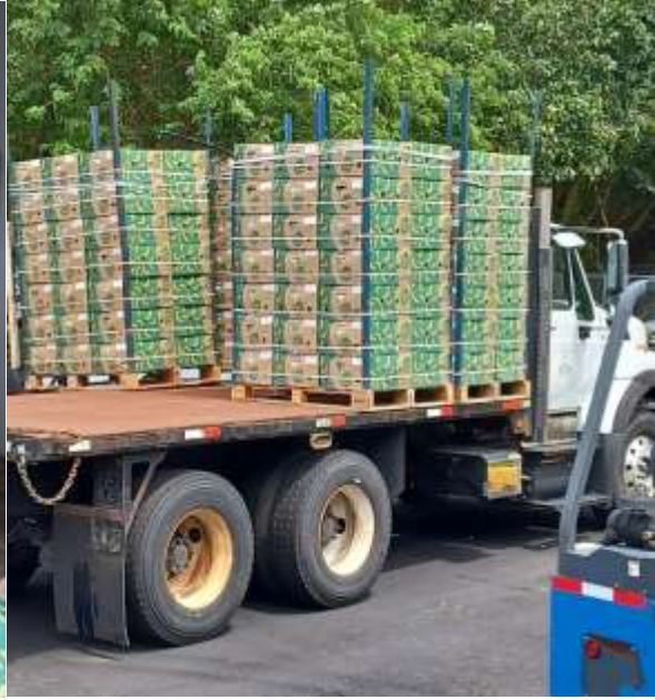
Guineos dispuestos el 15 de mayo en Cayey