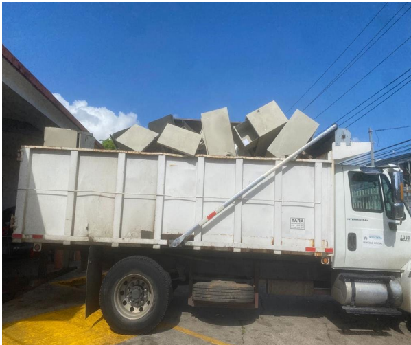
EQUIPOS A DISPONER EN BAYAMÓN