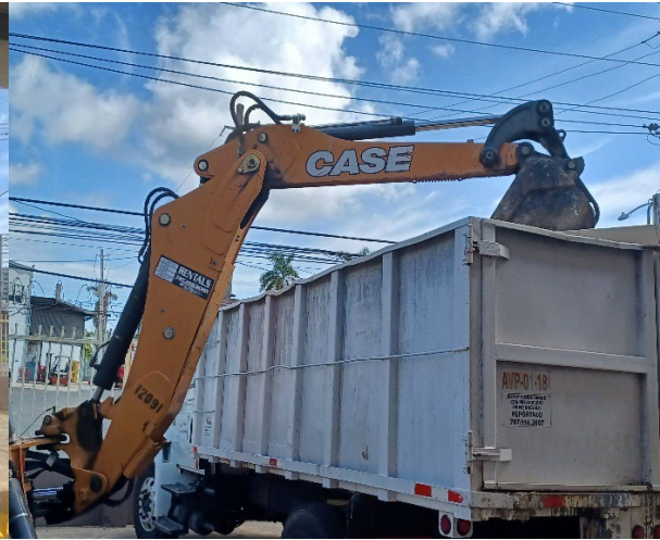
RECOGIDO DE EQUIPOS EN EL MOTORPOOL DESTRUCCIÓN DE EQUIPOS EN MOTORPOOL