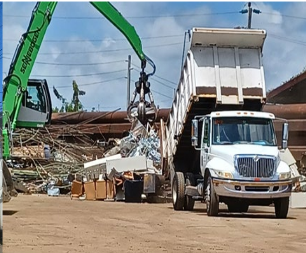
DEPOSITO Y DESTRUCCIÓN EN BAYAMÓN