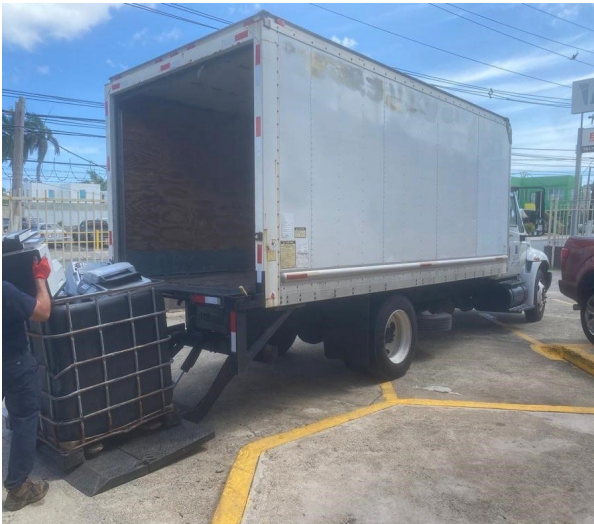
RECOGIDO DE EQUIPOS ELETRÓNICOS EN MOTORPOOL POR "REPR CORP."