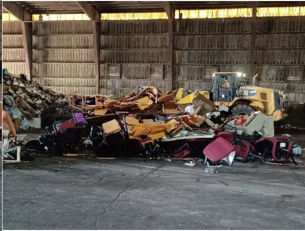
DESTRUCCIÓN DE EQUIPOS NO METALES