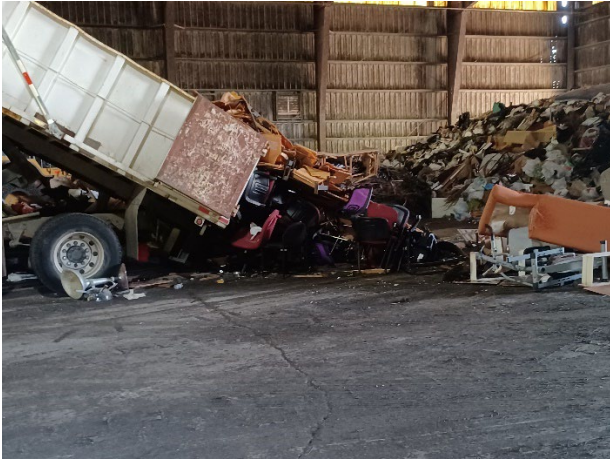
DEPÓSITO EQUIPOS NO METALES/GUAYNABO