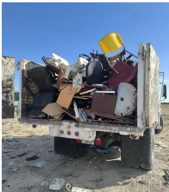
EQUIPOS NO METAL Y NO ELECTRÓNICOS DISPUESTOS EN VERTEDERO