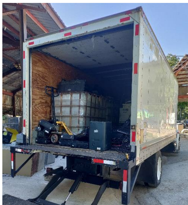
EQUIPOS ELECTRÓNICOS PARA DISPONER