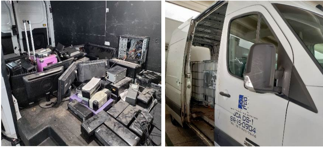
EQUIPOS ELECTRÓNICOS DISPUESTOS EN SAN JUAN (EDIFICIO AVP)