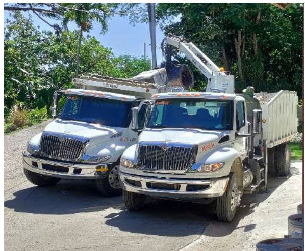
CARGANDO METALES EN CAMIÓN DE AVP