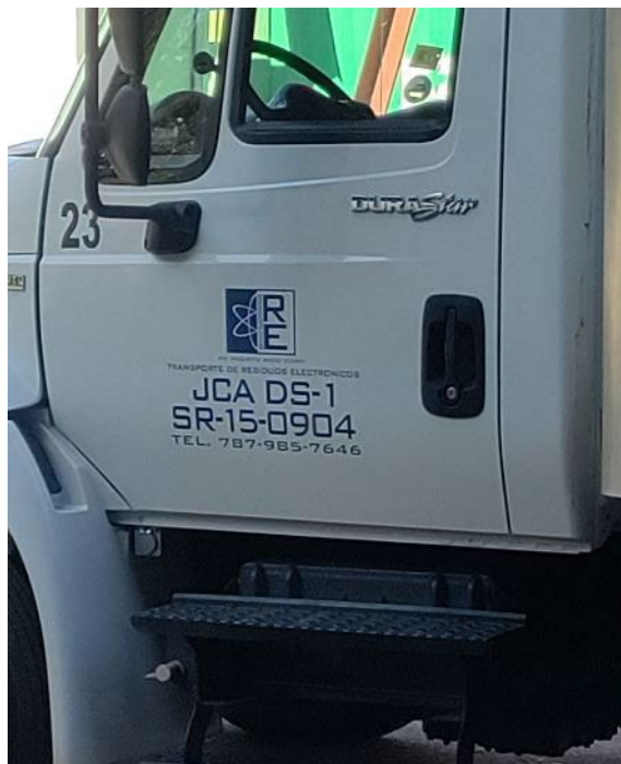
RECICLADORA DE ELECTRÓNICOS