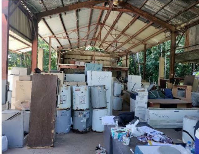
EQUIPOS PARA DISPONER