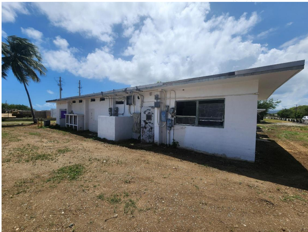
Figura No. 3: Estructura #192