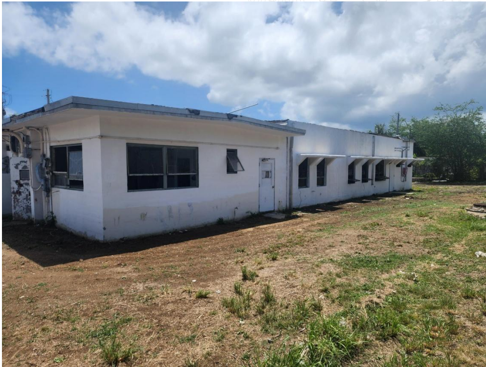
Figura No. 2: Estructura #192