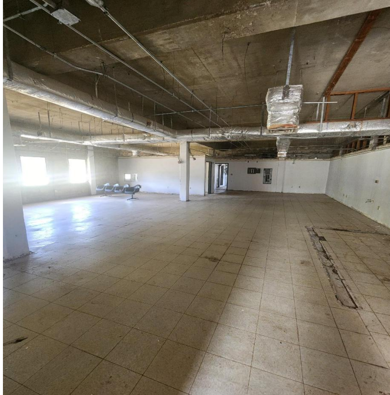
Figura No. 5: Estructura #192