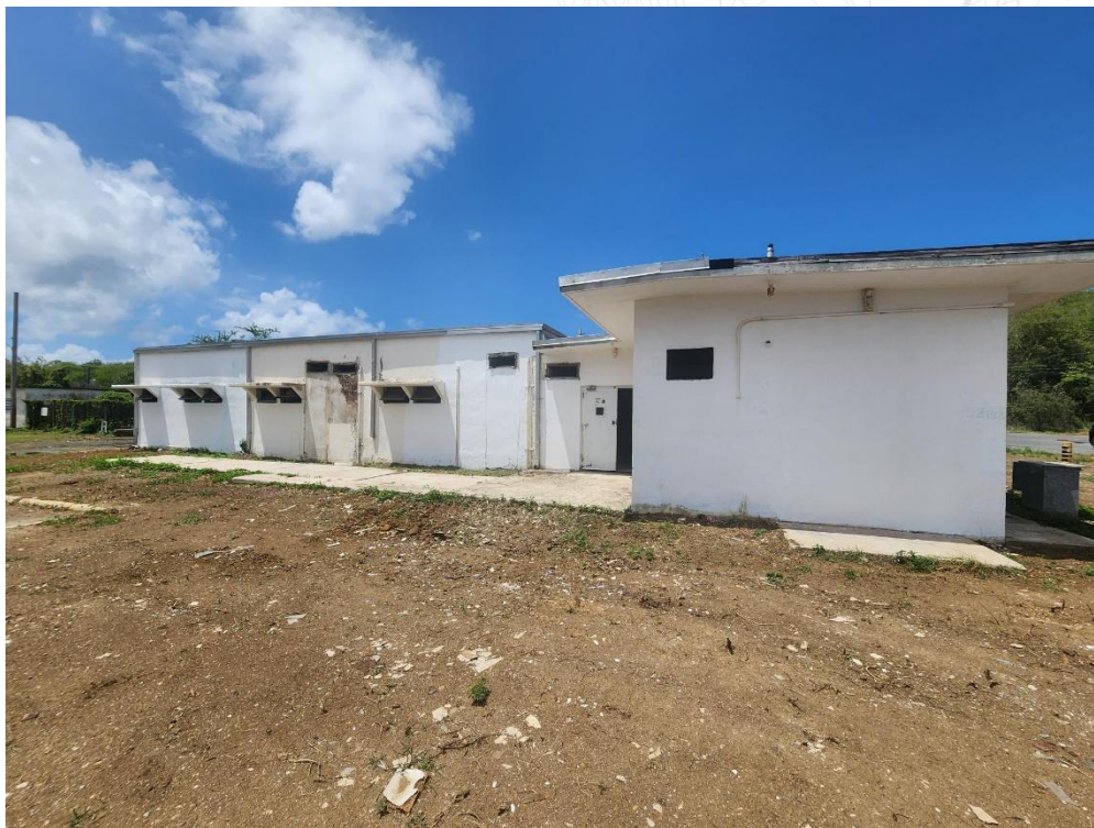
Figura No. 4: Estructura #192