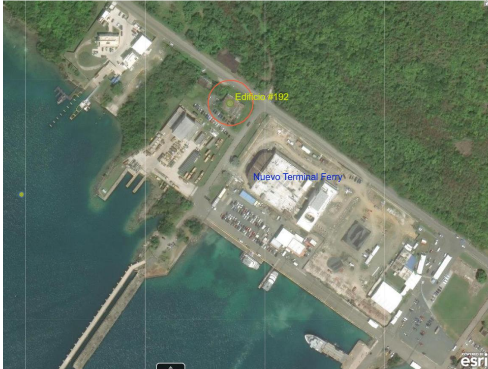
Figura No. 1: Mapa Localización Proyecto (Mapa Satélite) (18.231730, 65.620349)