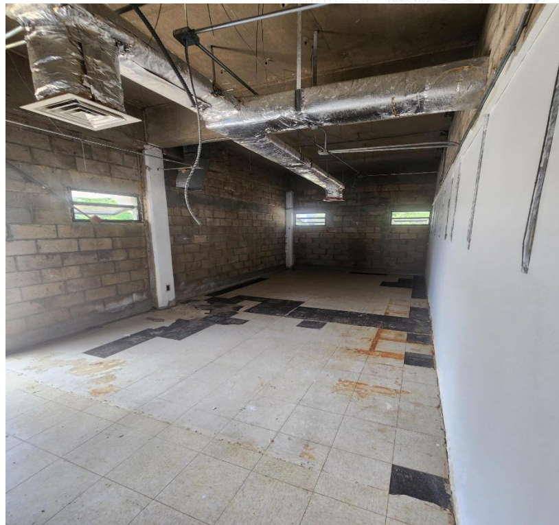
Figura No. 6: Estructura #192